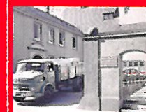
Haupteingang Klosterbrauerei 1950 – 1960