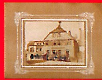
Kleinbeck- Brauerei 1890