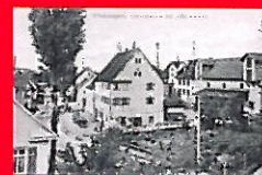
Adler- Brauerei um 1910