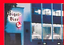
Kloster- brauerei 1965